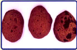
Bánh quy cần sa

Được làm từ nguyên liệu các dạng bánh quy trộn lẫn “bơ cần sa”, socola trộn “bơ cần sa”, (lá cần sa tươi hoặc khô trộn, chế biến cùng bơ thực phẩm)