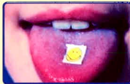
“Tem giấy”, “Bùa lười” (có tẩm chất ma túy LSD):

TRÊN CÁC NHÃN MẮC SẢN PHẨM ĐA SỐ ĐỀU CÓ LOGO NHẬN DIỆN HÌNH ẢNH LÁ, CÂY CẦN SA