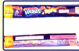
Kẹo, Kẹo mút cần sa

Được làm từ chất cần sa tươi hoặc khô trộn, chế biến cùng nguyên liệu làm kẹo.