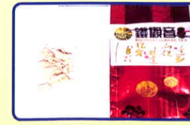
Trà sữa có chứa chất ma túy

Các loại nước uống, nước ngọt có chứa chất ma túy