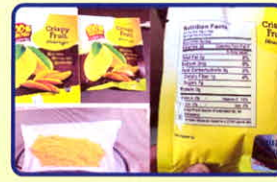
Nước “Xoài” có chứa chất ma túy