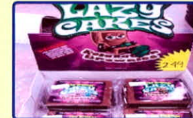
Bánh lười “Lazy Cakes”

Được làm từ chất cần sa tươi hoặc khô trộn, chế biến cùng nguyên liệu làm kẹo.