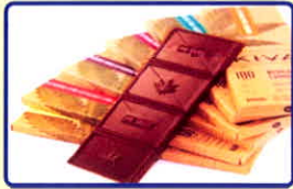
Socola cần sa

Được làm từ nguyên liệu các dạng bánh quy trộn lẫn “bơ cần sa”, socola trộn “bơ cần sa”, (lá cần sa tươi hoặc khô trộn, chế biến cùng bơ thực phẩm)