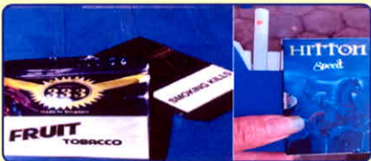
Thuốc lá điếu, thuốc lá TOBACO