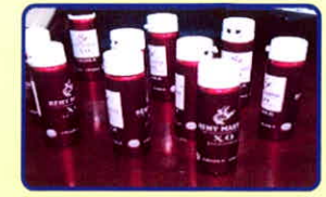
Nước “Vui” có chứa chất ma túy

Các loại nước uống, nước ngọt có chứa chất ma túy