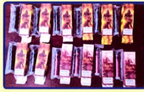
Thuốc lá điện tử có chứa chất ma túy